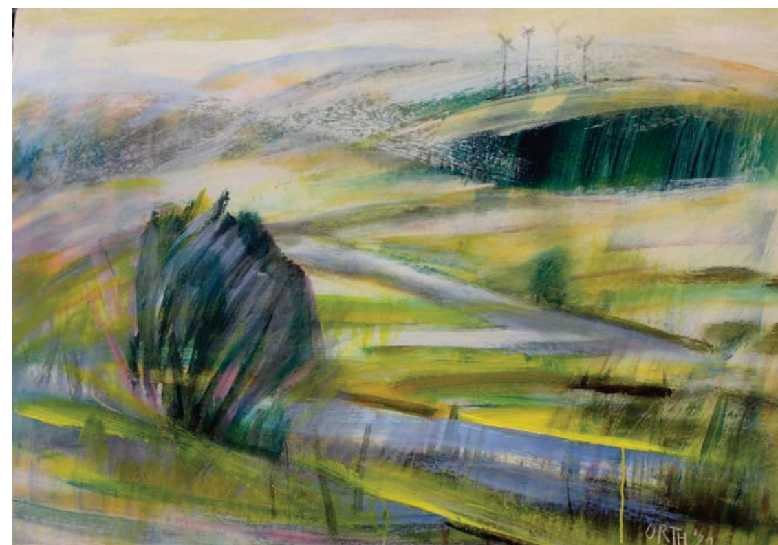
Štefan Ort, Pejsaž iz Zahor, 2021, akryl, 70x100 cm Štefan Orth, Krajina na Záhori, 2021, akryl, 70x100cm