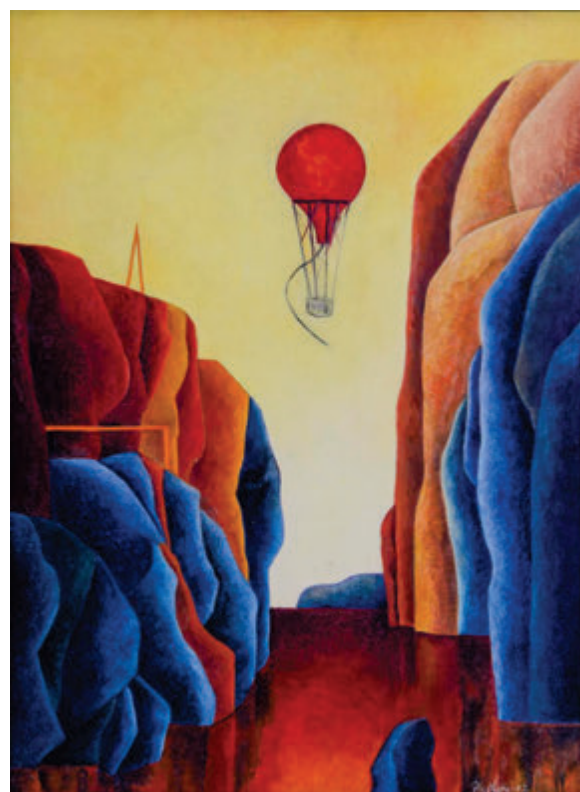
Olga Plačková, Fantazija i stvarnost, 2022, ulje, 43x33 cm Olga Plačková, Fantázia a skutočnosť, 2022, olej, 43x33 cm