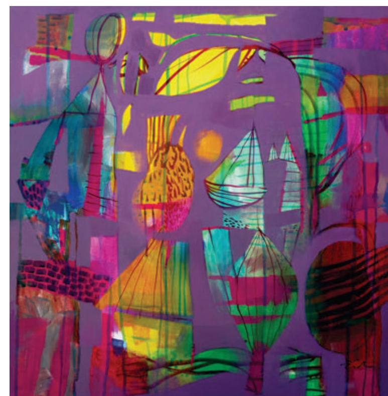
Tatjana Žitňanová, Nada, 2020, akril, 60x60 cm Tatiana Žitňanová, Nádej, 2020, akril, 60x60 cm