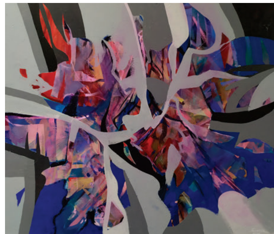
Vladimír Šuster, Igra novih oblika, 2019, akril, 100x119 cm Vladimír Šuster, Hra novotvarov, 2019, akril, 100x119 cm