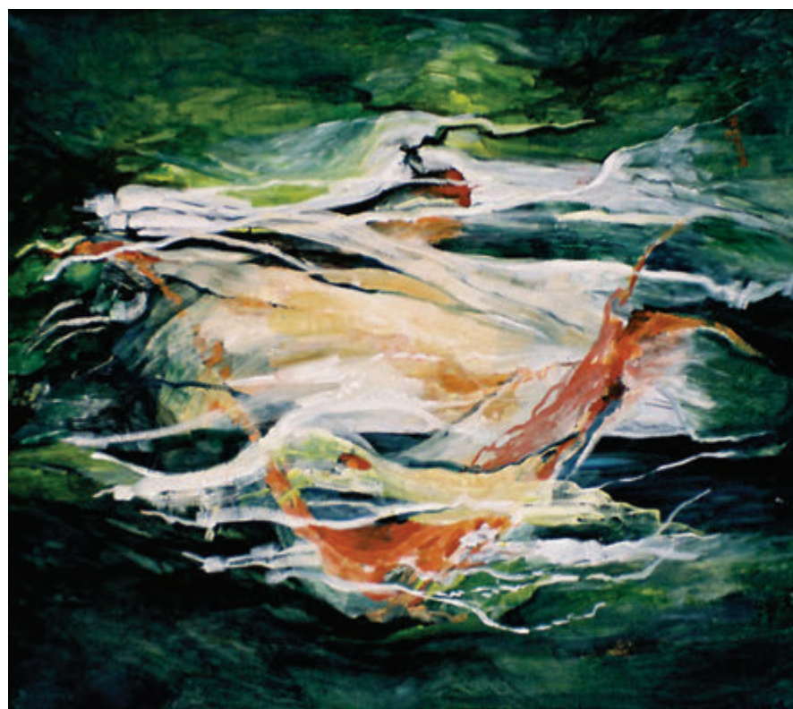
Zuzana Bobovska Boškova, Sazvuče, ulje, 80x90 cm Zuzana Bobovská Bošková, Súzvuk, olej, 80x90 cm