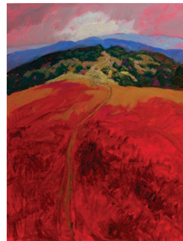
Miroslav Buher, Portret zemlje u brdima, 105x85 cm Miroslav Bucher, Portrét zeme -na horách, 105x85cm