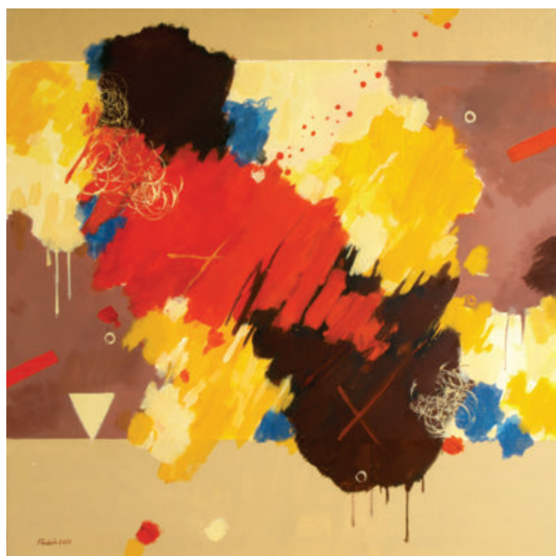
Milan Tvrdoň, Proboj, 2020, ulje, 80x80 cm Milan Tvrdoň, Prienik, 2020, olej, 80x80 cm