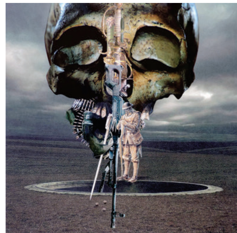
Emil Semanco, Ja guerre, 2020, kolaž, 50x50 cm Emil Semanco, La guerre, 2020, kolaž, 50x50 cm