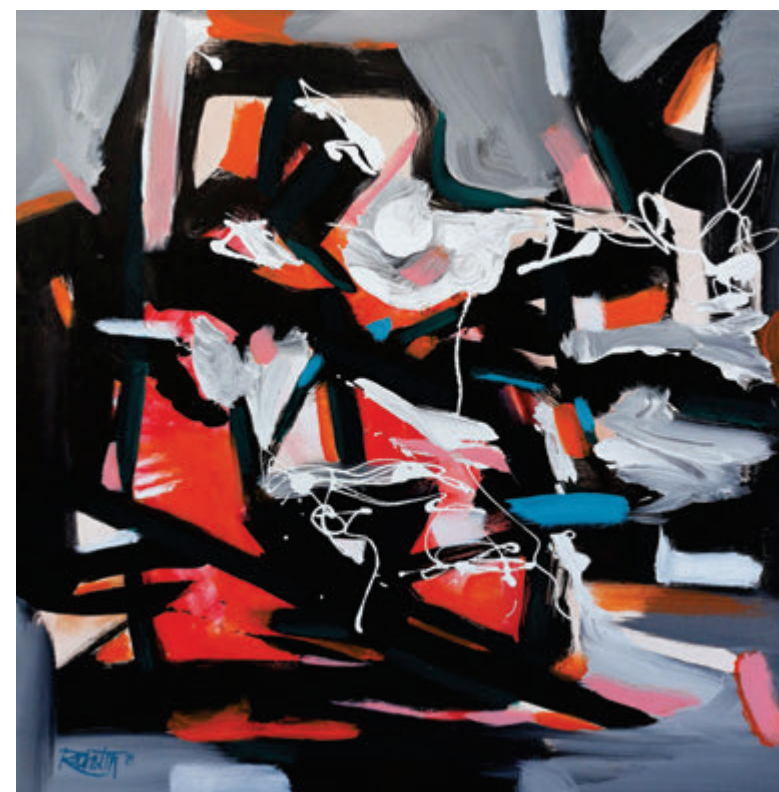
Rudolf Rabatin, Klavirski koncert, 2021, akril, 70x70 cm Rudolf Rabatin, Klavírny koncert, 2021, akril, 70x70 cm