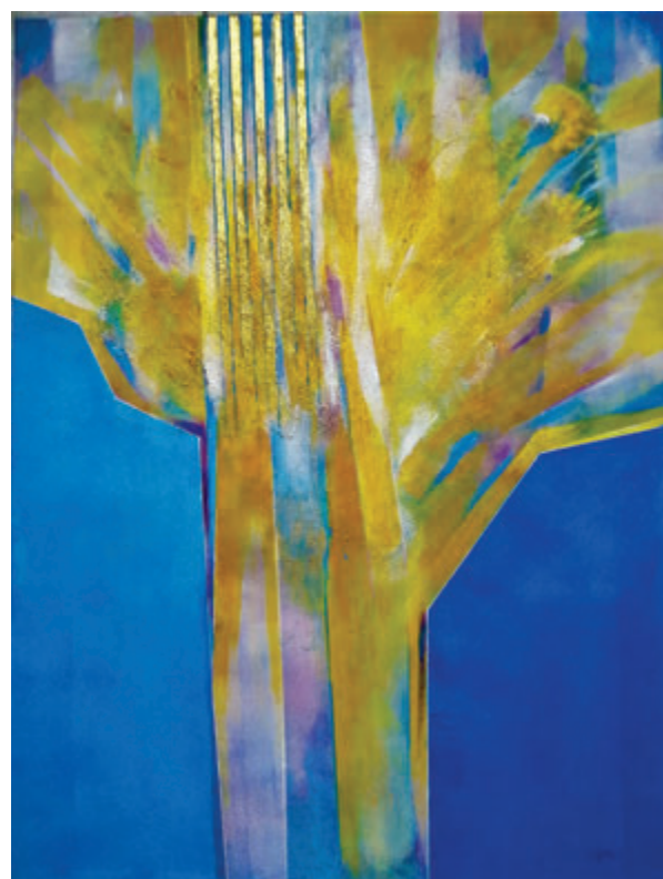
Jozef Švikruha, Beethoven, Oda radosti, 2021, akril, 70x60 cm Jozef Švikruha, Beethoven - Óda na radost', 2021, akril, 70x60 cm