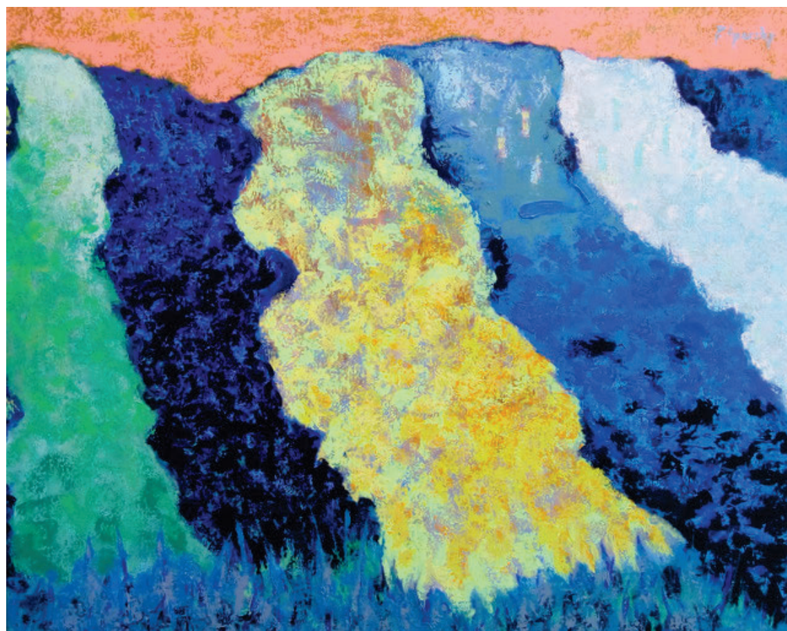
Jan Agarski, Pazovačko polje, 2018, akril, 80x100 cm Ján Agarský, Pazovské pole, 2018, akryl, 80x100 cm