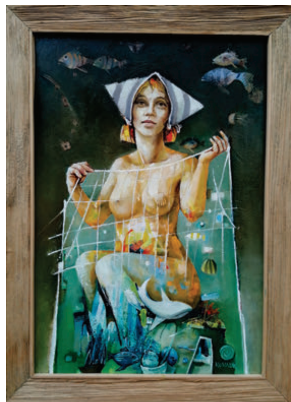
Jan Kovaljik, Možda jednom, 2022, 40x58 cm Ján Koválik, Možno raz, 2022, olej, 40x58 cm