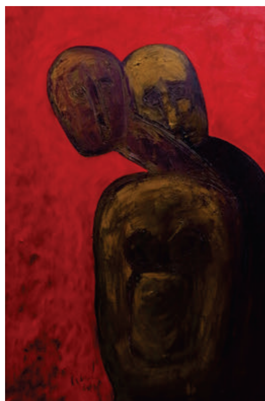
Ladislav Černi, Senke, 2018, ulje, 120x80 cm Ladislav Černý, Tiene, 2018, olej, 120x80 cm