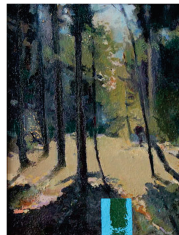
Jaroslav Uhel, Letnji dan, 2022, ulje 45x36 cm Jaroslav Uhel, Letný deň, 2022, olej, 45x36 cm