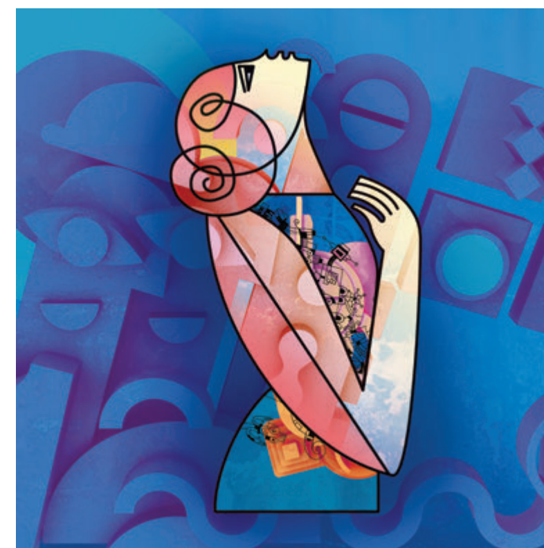
Petra Štefankova, Model, 2021, kompjuterska grafika, 50x50 cm Petra Štefanková, Modelka, 2021, počítačová grafika, 50x50 cm