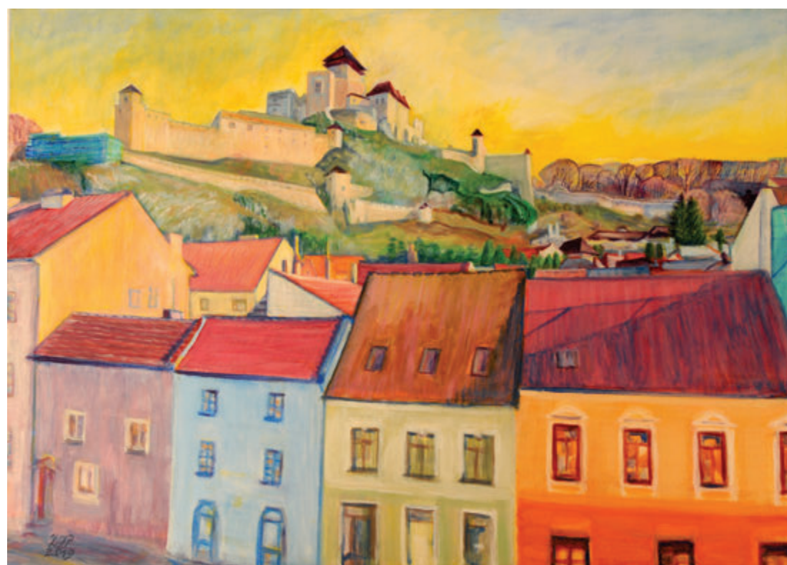
Zlatica Jurisova Pleškova, Obnova zamka, 2020, akril, 50x70 cm Zlatica Jurisová Plešková, Obnova hradu, 2020, akryl, 50x70 cm