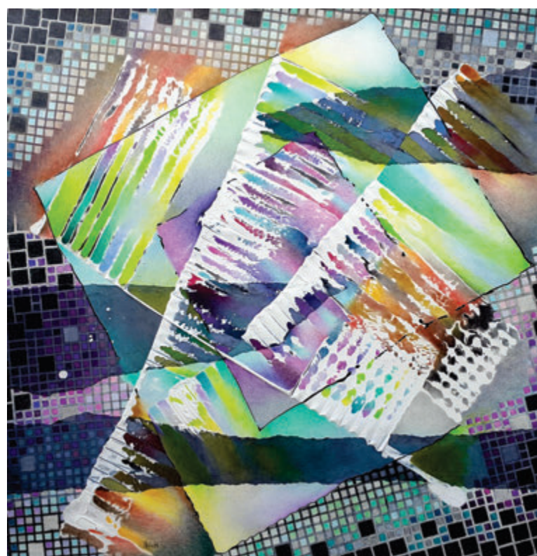
Miloslava Salanciova, Interpretacija, 2021, pastel, 50x50 cm Miloslava Salanciová, Interpretácia, 2021, pastel, 50x50 cm