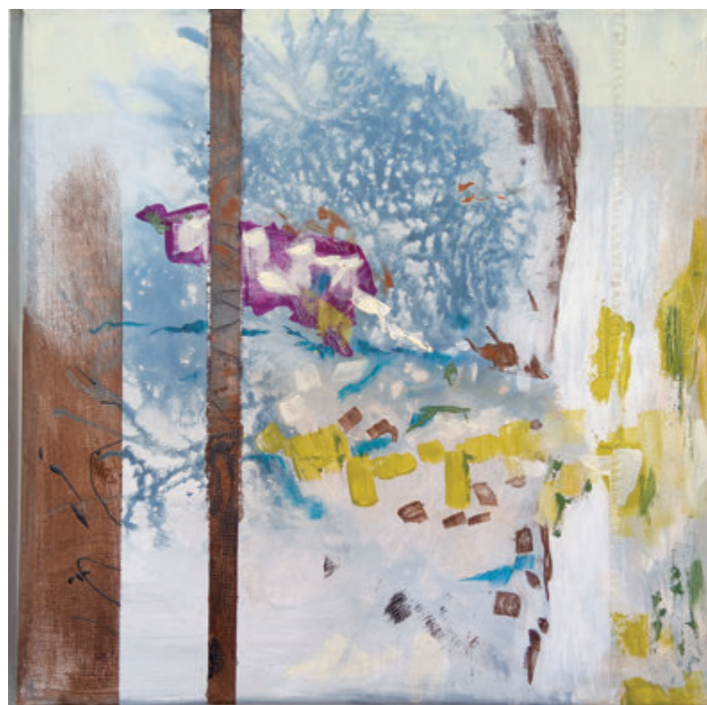
Miroslav Kinder, Pejsaž I, akryl, 40x40 cm Miroslav Kinder, Krajina I, akryl, 40x40 cm