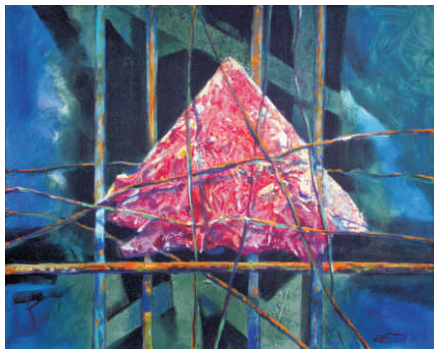
Pasca, 2014, akryl na plátne, 80 x 100 cm