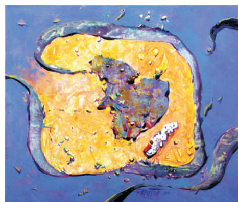
Výtvarný moment, 2017, akryl na plátne, 60 x 70 cm