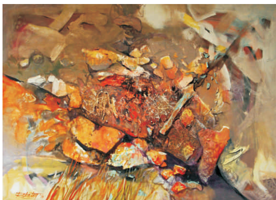
Pohyblivé kamene, 2014, akryl na plátne, 95 x 130 cm