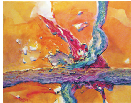
Abstrakcia, 2014, akryl na plátne, 80 x 100 cm