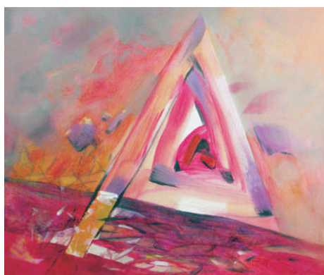
Výtvarný moment A, 2015, akryl na plátne, 60 x 70 cm