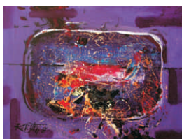
Nokturno, 2017, akryl na plátne, 30 x 40 cm