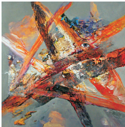
Pozorovateľ, 2017, akryl na plátne, 70 x 70 cm