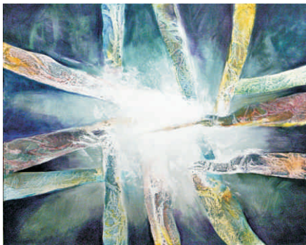
Väznené svetlo, 2014, akryl na plátne, 80 x 100 cm